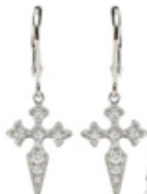
Markante (kr 8995, mytheresa.com).