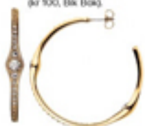
Gullfarget med strass (kr 750, Dyrberg/Kern).