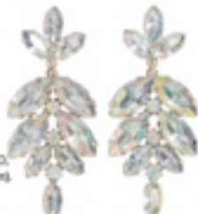
Giltrende steiner (kr 80, Lindex).