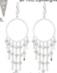
Søte med perler (kr 1450, Celine Engelstad).