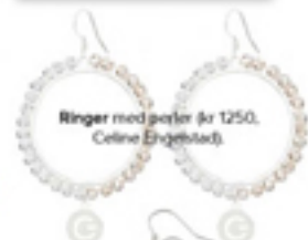
Ringer med perler (kr 1250, Celine Engelstad).