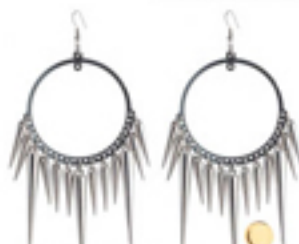
Edgy (kr 350, Tokyo Jena/ mytheresa.com).