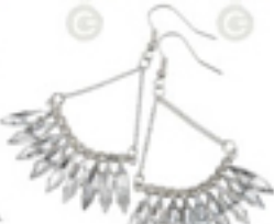
Selvfarget med perler (kr 100, Bk Bok).