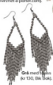
Grå med Lapis (kr 130, Bk Bok).