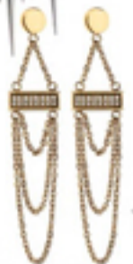
Gullfarget kjele (kr 700, Dyrberg/Kern).