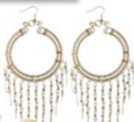
Gullfarget med byrjer (kr 80, Indiskul).